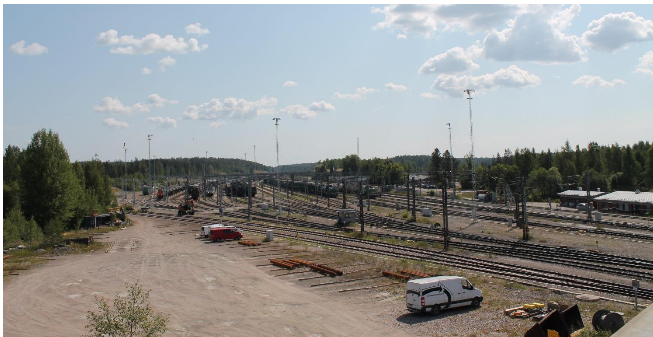
Kuva 4. Vainikkalan ratapiha

Osallistumis- ja arviointisuunnitelmaa täydennetään ja tarvittaessa muutetaan suunnittelun edetessä.