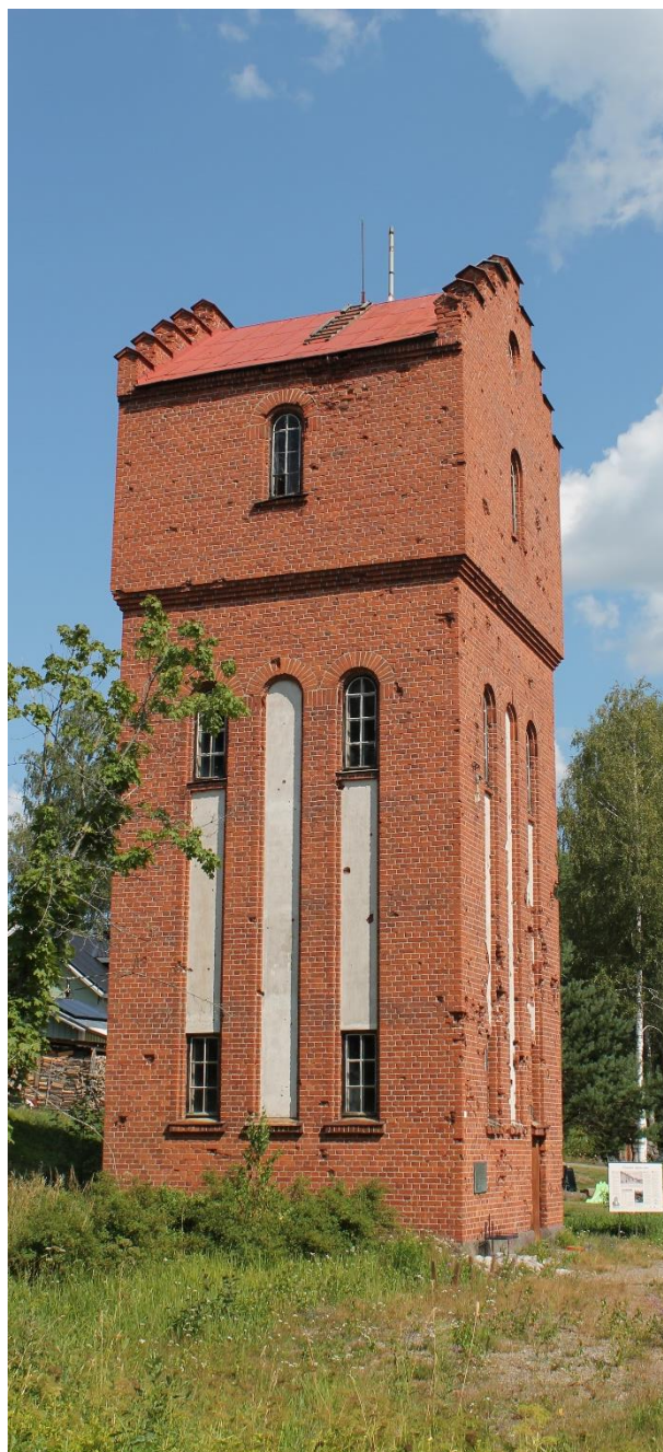
Kuva 3. Simolan aseman vesitorni