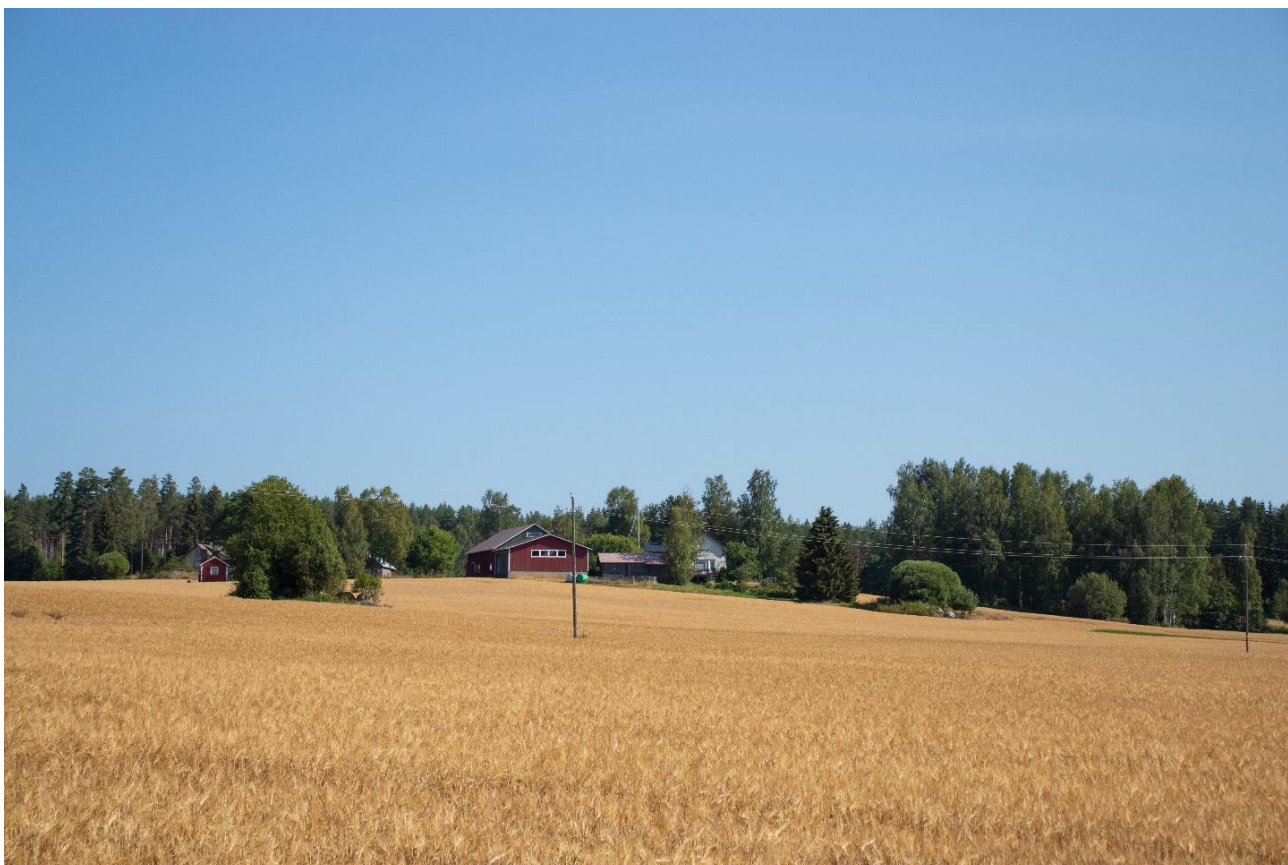
Kuva 2. Kasukkalan maalaismaisemaa

Maankäytön suunnittelun painopiste tulee olemaan pienvesistöjen rannoilla ja kylien alueella. Laaja kaava-alue mahdollistaa haja-asutusalueen maankäytön kokonaisrakenteen suunnittelun ja kyläalueiden tasapuolisen kehittämisen.